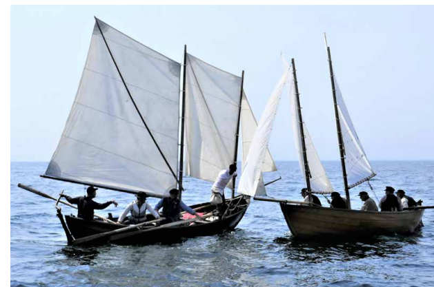
Pandemirodden 2021 .

Vi hoppas att alla får trevlig och intressant läsning! Nu seglar vi vidare för att få nästa bok i hamn.